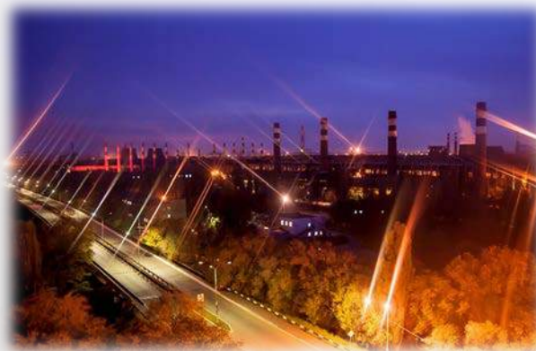
м. Кривий Ріг

Ліфти «ЄВРОФОРМАТ» встановлені не лише у житлових комплексах. Компанія розробляє рішення для комерційної нерухомості: офісних та торгових центрів, заводів, навчальних та медичних закладів.